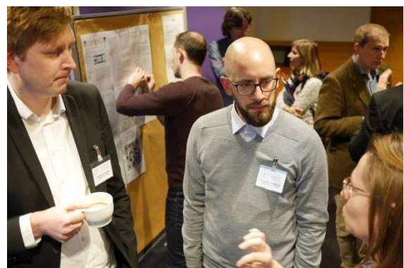
Intensiver Austausch zwischen Innovatoren und Stakeholdern